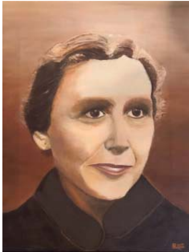
Retrato pintado por: Rosario González Cascón

Cada capítulo refleja un aspecto esencial de dicha espiritualidad, a través de la selección de textos que propone cada autora, de manera que cada capítulo tiene su entidad, pero es el conjunto de los ocho el que ofrece una visión más integrada de su espiritualidad. Si recorremos estos ocho capítulos nos vamos a encontrar con el primero, "Una vocación laical" de María Rita Martín Artacho, que pone el acento en una vocación laical. El segundo, "Espiritualidad cristocéntrica, inspirada en Teresa de Jesús" de Lucía Pedrosa-Padua nos presenta textos que muestran la centralidad de Jesucristo y la referencia a Teresa de Jesús. A continuación, el capítulo tercero "Oración y estudio" de Carmen Azaustre Serrano, ofrece textos